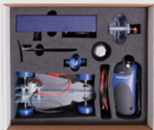
Caja de almacenamiento

Los componentes individuales del modelo de coche de pila de combustible pueden utilizarse de varias maneras para la enseñanza. Usted descubra las posibilidades.