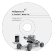
CD-ROM (en Inglés)