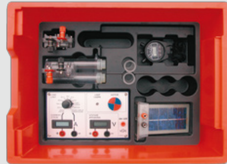
Caja de almacenamiento

Los componentes del equipo de pila de combustible pueden ser utilizados de varias maneras para la enseñanza. Descubra las posibilidades.