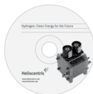
CD-ROM (en Inglés)

El CD-ROM que se incluye contiene dos videos y dos presentaciones en Power Point sobre los principios y aplicaciones de la tecnología de pila de combustible y dos experimentos con el equipo de pila de combustible.